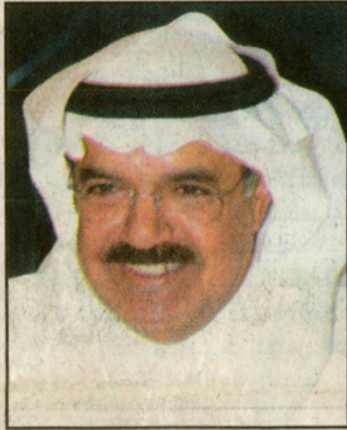
الطويل.. التعليمات صدرت

ناصر السايير : سمو الرئيس «داز عمره» اقتصادياً وما نريده منه التخلي عن السياسة التي أعاققت نمونا