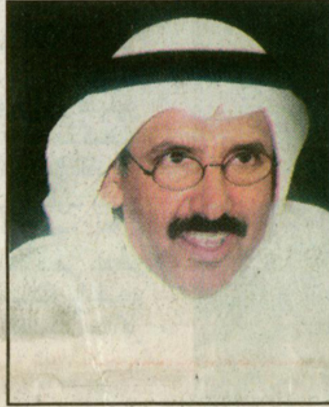
ناصر السايير.. اقتصاد لا سياسة